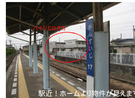
駅近! ホームより物件が見えます